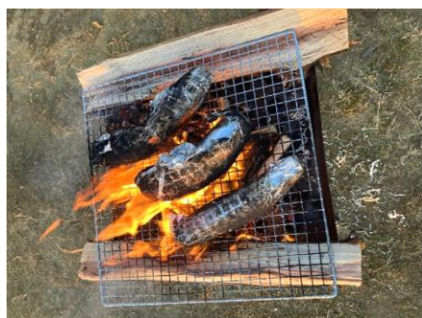
たき火でホカホカ焼きいも 🍠 👍