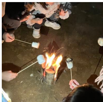
👍 みんなで焼きマシュマロとホットココア 👍