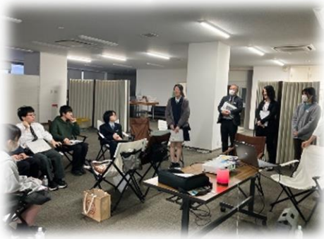
中学生から大学生までが集まり、初めましての皆さんに自己紹介

4/17（木）燕市役所まちあそび部メンバーをはじめ、燕庁舎の利活用に興味のある市内の学生8名が参加し、第1回燕庁舎利活用ワークショップを開催しました。以前から市内に若者が集まる勉強スペースが少ないことが課題となっていたところ、燕駅にほど近い燕庁舎にあった水道局が移転して空いたことから、燕庁舎に学生向けの勉強スペースを設置する話が立ち上がりました。その空間創出にあたり、実際に使用する学生のアイデアを具体化するため、計3回にわたり「燕庁舎利活用ワークショップ」を計画。今回はその第1回目、実際に燕庁舎に学生が集まり、現地を見ながらワークショップを実施しました。