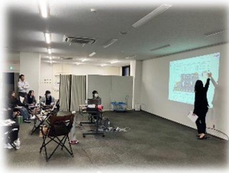
KOKUYOの説明を受ける学生

まずは施設の見学「思ってるよりも広い」「全然きれい」この空間を自分たちのアイデアで変えていけることにワクワクしている様子。